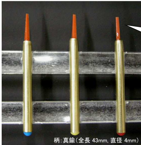
柄：真鍮（全長 43mm、直径 4mm）