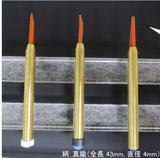
柄:真鍮(全長 43mm, 直径 4mm)