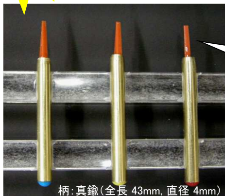
柄：真鍮(全長 43mm, 直径 4mm)